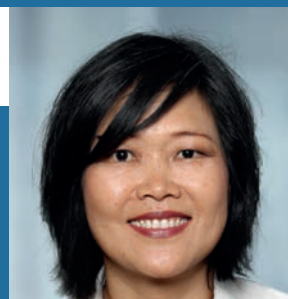
Lisa Lor forum bp